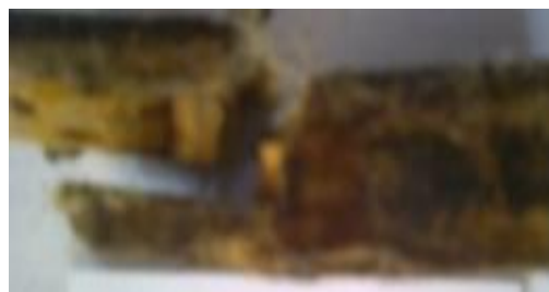
Gambar 4 Spesimen dengan fraksi volume serat sisal (10%) dengan arah serat searah

Kekuatan impact komposit sandwich dengan variasi fraksi volume serat sisal (5%) pada arah serat searah merupakan yang paling rendah untuk spesimen dengan arah serat searah.