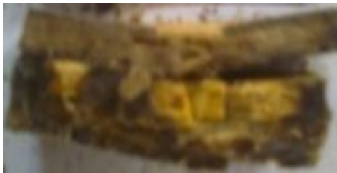
Gambar 6 Spesimen dengan fraksi volume serat sisal (20%) dengan arah serat searah

Selanjutnya peningkatan kekuatan impact juga terjadi pada spesimen dengan fraksi volume serat sisal (15%). Hal ini terlihat dari tingkat cacat spesimen yang semakin berkurang.