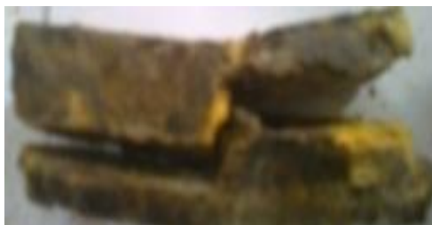
Gambar 7 Spesimen dengan fraksi volume serat sisal (25%) dengan arah serat searah

Kemudian pada spesimen dengan fraksi volume serat sisal (20%) menunjukkan peningkatan seiring semakin besarnya fraksi serat pada spesimen.