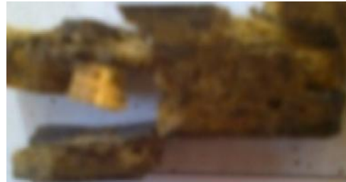
Gambar 9 Spesimen dengan fraksi volume serat sisal (5%) dengan arah serat acak

Begitu pula pada spesimen dengan fraksi volume serat sisal (30%), dimana fraksi volume serat sisal yang semakin besar membuat kekuatan impact pada spesimen juga semakin besar.