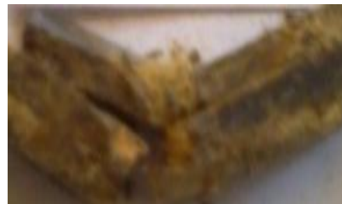
Gambar 10 Spesimen dengan fraksi volume serat sisal (10%) dengan arah serat acak

Sedangkan pada spesimen dengan fraksi volume serat sisal (5%) pada arah serat acak menunjukkan kekuatan impact yang lebih tinggi jika dibandingkan dengan kekuatan impact spesimen dengan fraksi volume serat sisal (5%) pada orientasi arah serat searah.