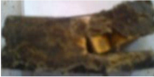
Gambar 5 Spesimen dengan fraksi volume serat sisal (15%) dengan arah serat searah

Selanjutnya peningkatan kekuatan impact juga terjadi pada spesimen dengan fraksi volume serat sisal (15%). Hal ini terlihat dari tingkat cacat spesimen yang semakin berkurang.