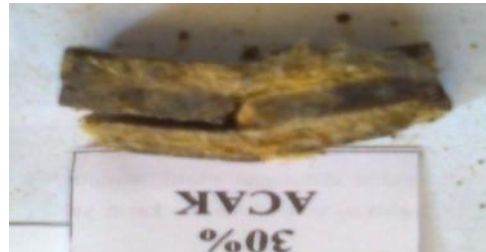
Gambar 14 Spesimen dengan fraksi volume serat sisal (30%) dengan arah serat acak

Seperti spesimen sebelumnya pada spesimen dengan fraksi volume serat sisal (25%) juga mengalami peningkatan seiring dengan penambahan fraksi serat pada spesimen.