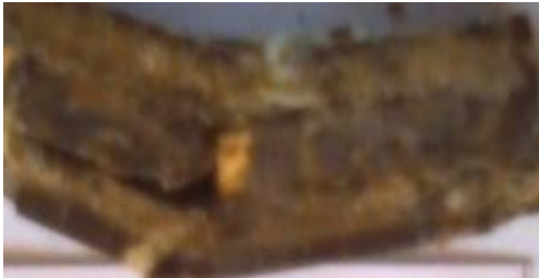
Gambar 12 Spesimen dengan fraksi volume serat sisal (20%) dengan arah serat acak

Begitupun pada spesimen dengan fraksi volume serat sisal (15%) juga mengalami peningkatan kekuatan impact yang ditunjukkan dengan tingkat kegagalan yang terjadi pada spesimen.