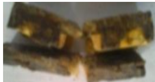
Gambar 3 Spesimen dengan fraksi volume serat sisal (5%) dengan arah serat searah

Berdasarkan grafik 2 di atas kekuatan impact dengan fraksi volume serat sisal 30% pada arah serat acak memiliki kekuatan impact paling besar yaitu 0,0460 J/mm 2 lebih tinggi dibandingkan dengan fraksi volume serat 30% pada arah searah dengan kekuatan impact 0,044 J/mm 2 .