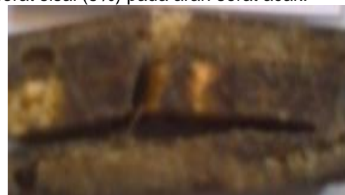
Gambar 11 Spesimen dengan fraksi volume serat sisal (15%) dengan arah serat acak

Berikutnya kekuatan impact spesimen dengan fraksi volume serat sisal (10%) pada arah serat acak semakin meningkat, lebih tinggi dari spesimen dengan fraksi volume serat sisal (5%) pada arah serat acak.